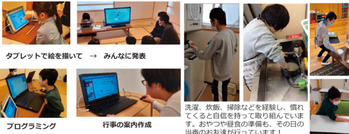
タブレットで絵を描いて → みんなに発表